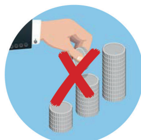
Kein elektr. Zahlungsverkehr