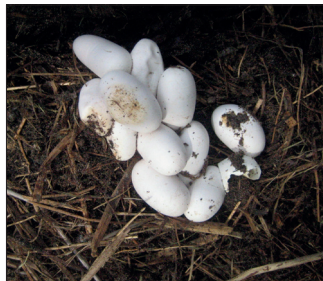
Eigelege in einem Komposthaufen, Foto: Georg Wilhelm / Wikipedia

Im Frühjahr beginnt die Paarungszeit. Ab Mitte Juni legt das Weibchen 10 bis 40 Eier an ausgesuchten Plätzen ab: gerne tief in Kompost-, Mist-, Laub- oder Schilfhaufen, wo die Eier allein von der Gärungswärme ausgebrütet werden. Manchmal nutzen die Tiere auch Fernwärmeschächte oder Asphalthöhlen unter besonnten Feldwegen. Besonders geeignete Plätze sind begehrt und so kann man nicht selten hunderte Eier auf