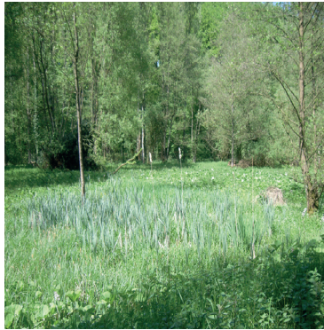
Feuchtgebiet im Angertal

Die Ringelnatter gehört zu den besonders geschützten Arten. Unter anderem ist es gesetzlich verboten, sie der Natur zu entnehmen, sie zu beschädigen, sie zu töten oder ihre Fortpflanzungs- und Ruhestätten bzw. Standorte zu beschädigen oder zu zerstören. Leider werden diese harmlosen und in NRW stark gefährdeten Tiere trotzdem immer wieder aus Unwissenheit, Angst oder Mutwilligkeit erschlagen. Oder sie enden als Verkehrstopfer auf unseren Straßen.