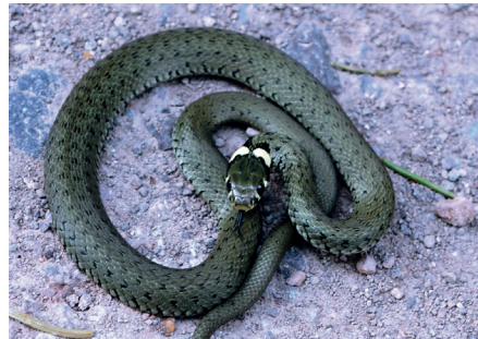
Ringelnatter in voller Pracht

Frau Peschkes-Kessebohm Telefon 02104/ 99-2815 Herr Schmidt Telefon 02104/ 99-2827 Herr Göddecke Telefon 02104/ 99-2806