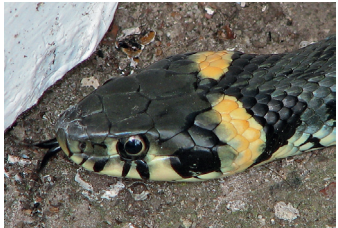
Kopf einer Ringelnatter mit gelben Mondflecken

Die einzige Schlange, die im Kreis Mettmann häufig vorkommt und sogar in Siedlungen zu finden ist, ist die Ringelnatter ( Natrix natrix ). Alle uns bisher gemeldeten und überprüften Schlangenfunde waren Ringelnattern.